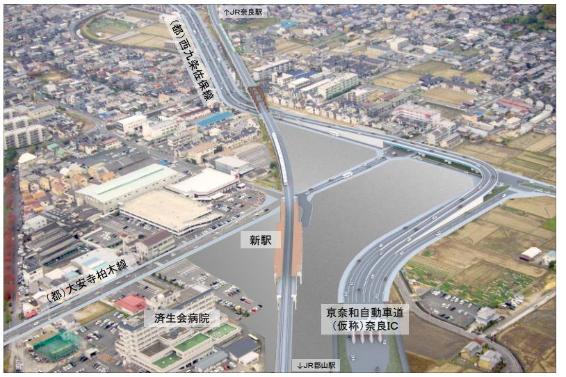
【整備イメージ(西九条佐保線)】